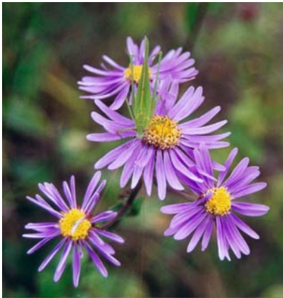
L'Ophrys bourdon (Ophrys fuciflora)

Les « pelouses sèches » ont souvent pour origine d'anciennes activités anthropiques (défrichement, vigne, pâturage...) suivi d'un abandon qui, s'il est trop prolongé, aboutit à une fermeture naturelle par embroussaillage et donc à une disparition des espèces de milieux ouverts.