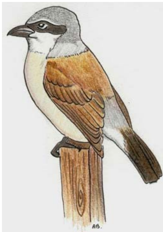
Pie grièche écorcheur

Suite au travail de concertation mené par le Conservatoire des Espaces et Paysages d'Auvergne (CEPA), association de préservation du patrimoine naturel, avec les acteurs locaux et la commune de Clermont-Ferrand, des actions pour la conservation, la gestion et la valorisation du site ont été proposées. La mise en œuvre de ces actions sera réalisée en collaboration et en accord avec les propriétaires sur le site.