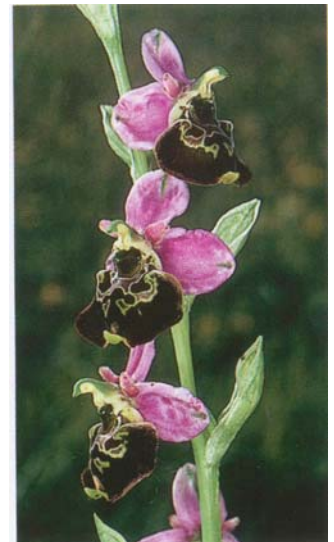
L'Aster amelle ou Marguerite de Saint-Michel (Aster amellus)

Tige assez robuste de 10 à 30 cm de haut. 3 à 7 fleurs, assez grandes (28 mm), vivement colorées, en inflorescence lâches. Présence d'une protubérance jaune dans la partie inférieure du labelle, non présente chez l'Ophrys abeille.