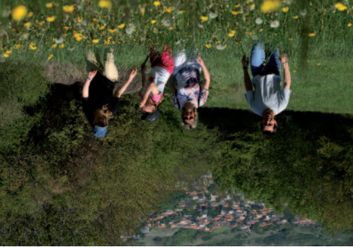
Au nord du site des Côtes, la vallée du Bédât, l'une des mieux préservées de l'agglomération, sépare Blanzat des premières pentes.

Sachez que vous randonnez à vos propres risques, et êtes responsable des dommages ou accidents qui pourraient survenir à vous-même ou au préjudice d'un tiers du fait de l'inadaptation de votre comportement aux lieux et aux dangers normalement prévisibles en milieu naturel.